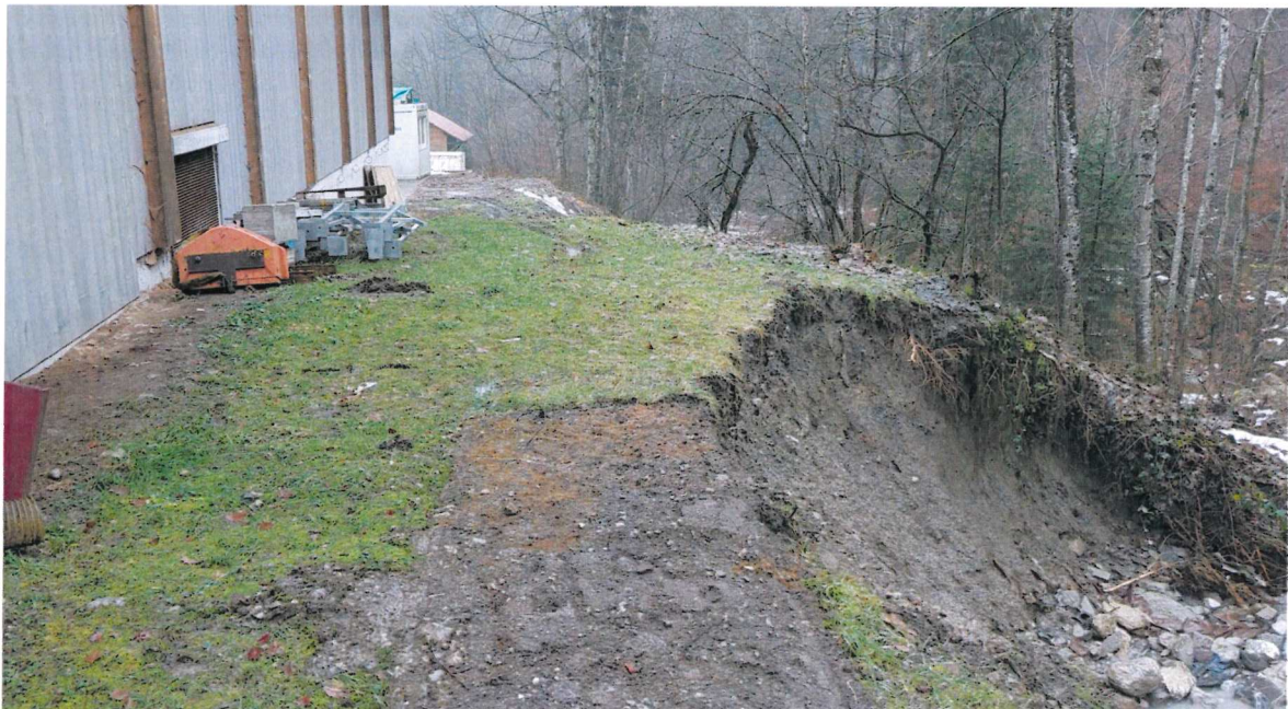
Erosion et glissement de terrain au droit du bâtiment de l'entreprise Freddy Oguey SA