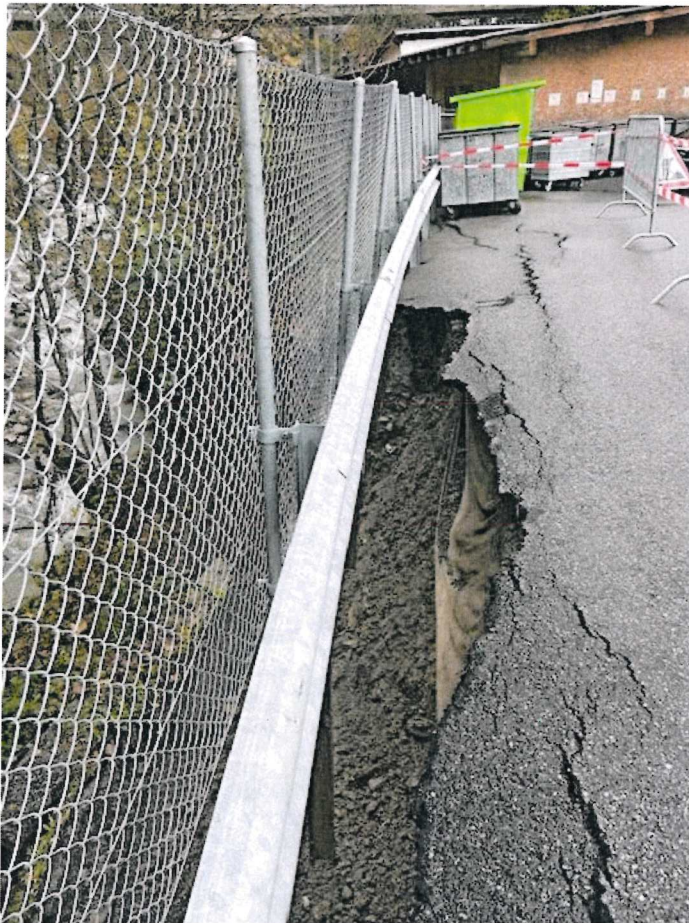
Erosion et glissement de terrain au droit de la déchetterie